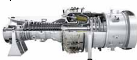
Illustration: Courtesy of Siemens

En ökad utbyggnad av vind- och solenergi skapar ett ökat behov av reservkraft. Gasturbiner, som snabbt kan generera reservkraft är ett bra alternativ. Men tillgången på naturgas och biogas är begränsad i Sverige. Metanol är ett utmärkt drivmedel för gasturbiner. I framtiden kommer gasturbiner drivna med bioMetanol att bli en viktig del av kraftreserven.